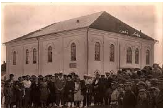
De synagoge in Ruzany in betere tijden