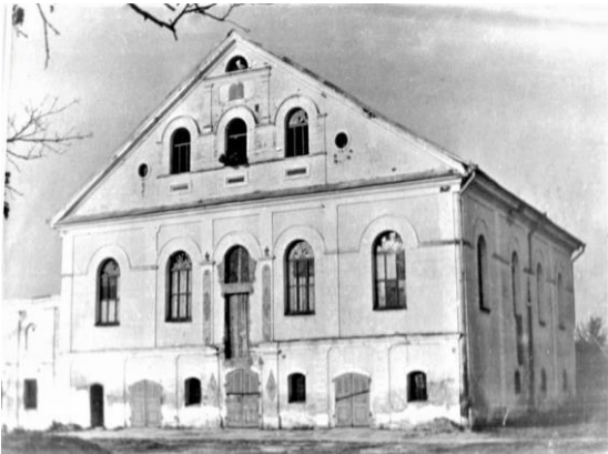
Kobrin Synagogue in 1949