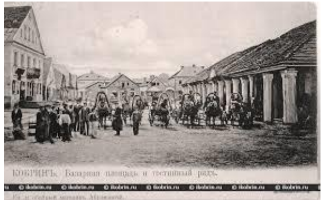
Kobrin in vroegere tijden.

In 1897 telde de totale bevolking van Kobrin 10.408 personen. Onder hen waren 6.738 Joden, 65%! In 1915, tijdens de eerste wereldoorlog, kwamen veel joodse vluchtelingen aan in Kobrin die ontsnapten aan Duitse troepen. In die tijd woonden er meer dan 300 mensen op het terrein van de synagoge. Op 2 augustus 1915 lieten Duitse vliegtuigen een paar bommen vallen in het gebied van de synagoge, en de zuidwestelijke hoek van het gebouw kreeg ernstige schade. Het werd 3 jaar later in 1918 gerestaureerd.