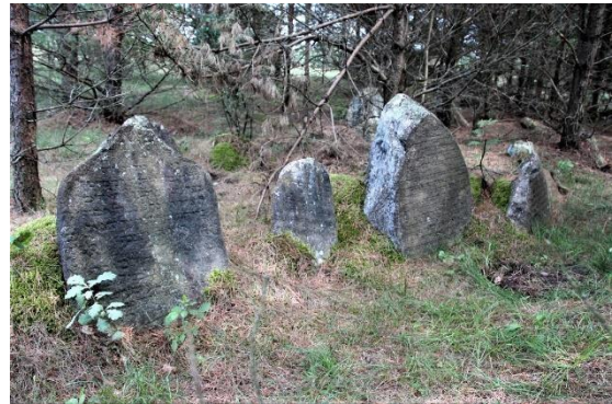
en restanten van de joodse begraafplaats