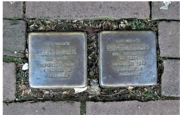
Het pand Markt 12 in Rees met de geplaatste Stolpersteine: