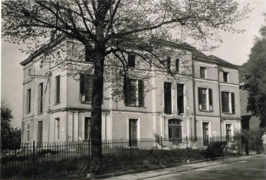
Villa Marguerite c.q. Het Jongenshuis in 1949.

Op 11 december was het 80 jaar geleden dat het grootste deel van de ongeveer negentig Joden die in Het Jongenshuis aan de Amsterdamseweg 1 woonden werden gedeporteerd naar Westerbork. De meesten van hen werden later vermoord in de vernietigingskampen Sobibor en Auschwitz. Moet er in onze wijk daarom geen ‘plaats van herinnering’ komen, want niets herinnert nog aan Het Jongenshuis en de afschuwelijke gebeurtenissen?