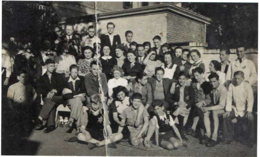
Bewoners van Het Jongenshuis in 1942.

Looijen komt tot de constatering dat niet alle 141 Joden tegelijk in 'Het Jongenshuis' woonden en dat er niet één maar twee deportaties naar Westerbork